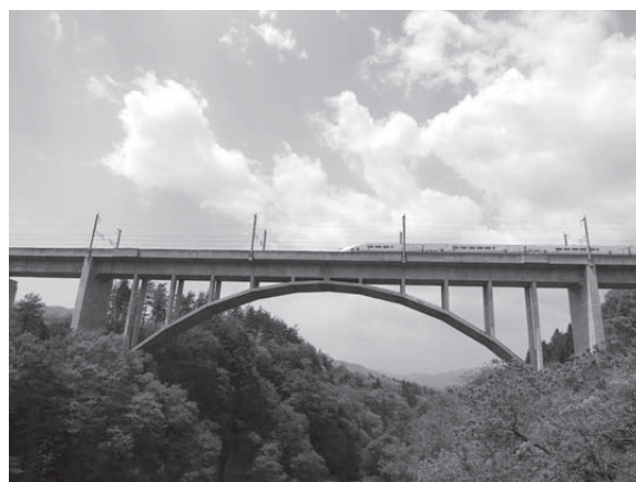
参考写真：赤谷川橋梁（上越新幹線）